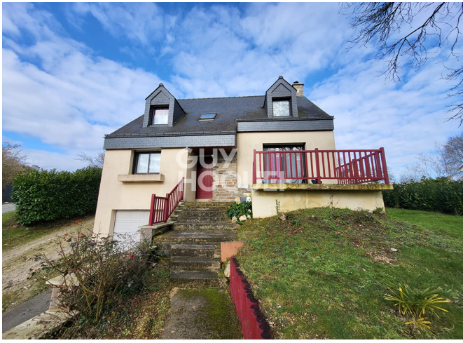
Photo du bien